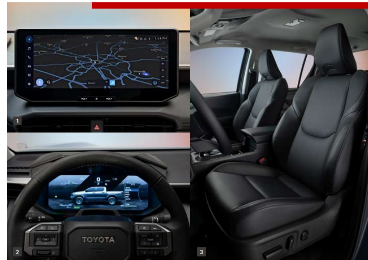
1. Pantalla táctil central 2. Cuadro de instrumentos digital 3. Nuevo diseño interior

Encendido remoto del desempañado de lunas