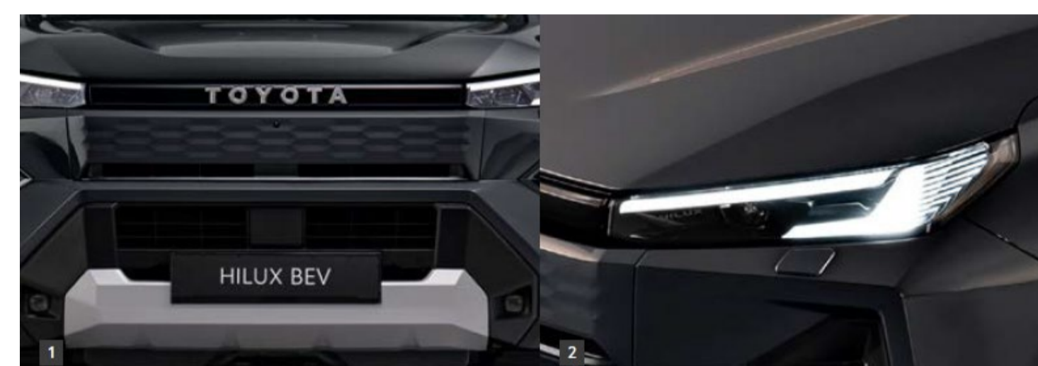
1. Nuevo frontal rediseñado 2. Nueva arquitectura robusta