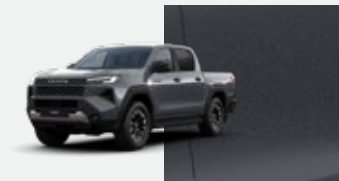
1M2 Gris Trueno