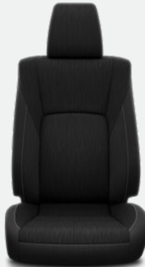
Tapicería de Tela Negra (FE20)