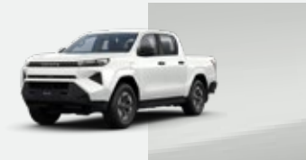
089 Blanco Perlado