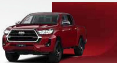
3T6 Rojo Vulcano