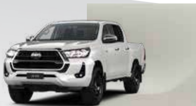
089 Blanco Perlado