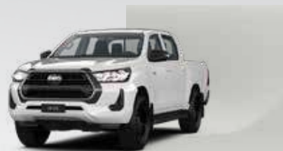
040 Blanco Classic*