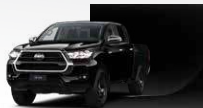
218 Negro Cosmo