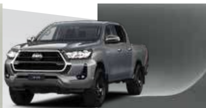
1D6 Plata Luna