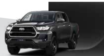
1G3 Gris Grafito