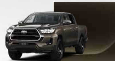
6X1 Bronce Oliva

*Abadao GX solo disponible en Blanco Classic